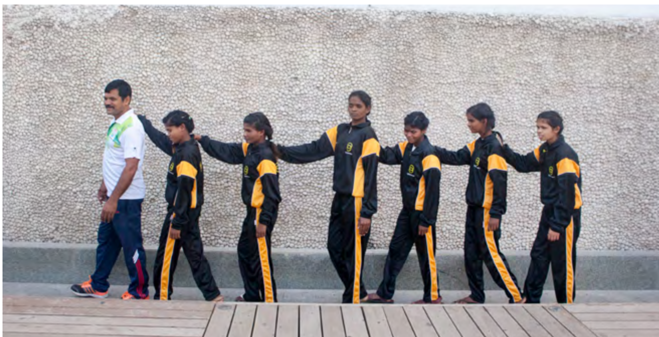
En grupp kvinnor med funktionsnedsättning i Pakistan stärker sin tro på egen förmåga genom att lära sig judo.